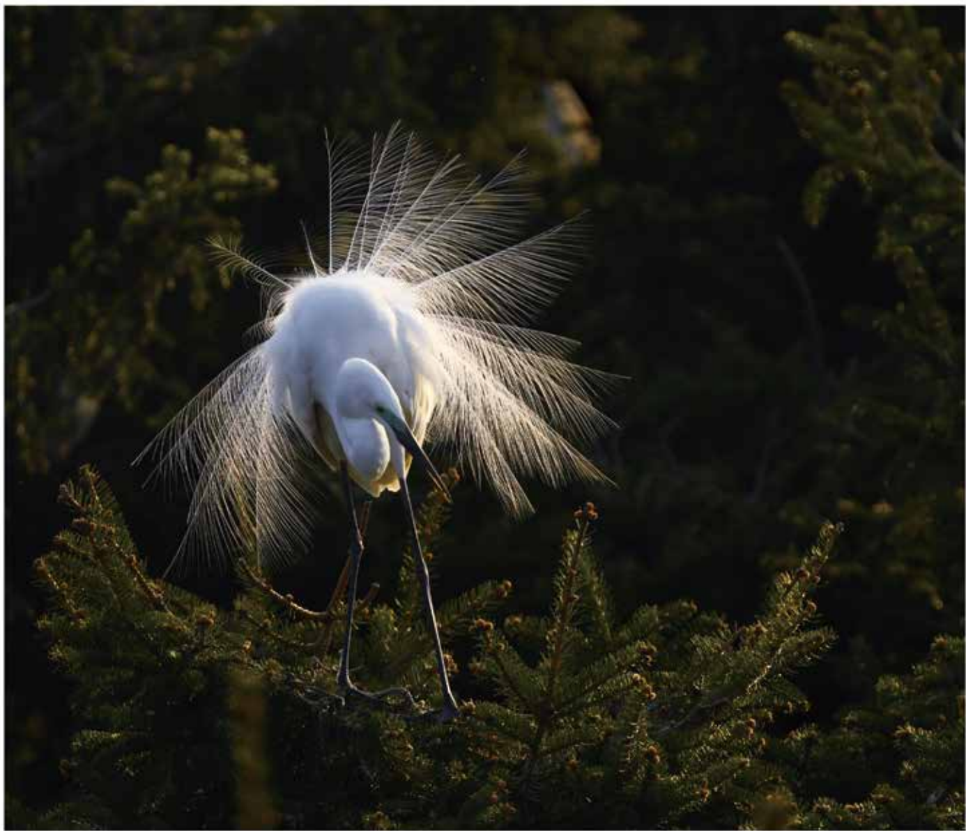
白羽如蓑，其华灼灼