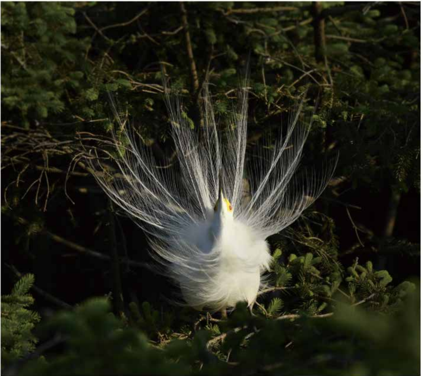
美丽的繁殖羽、小红眼，标志着发情期的到来