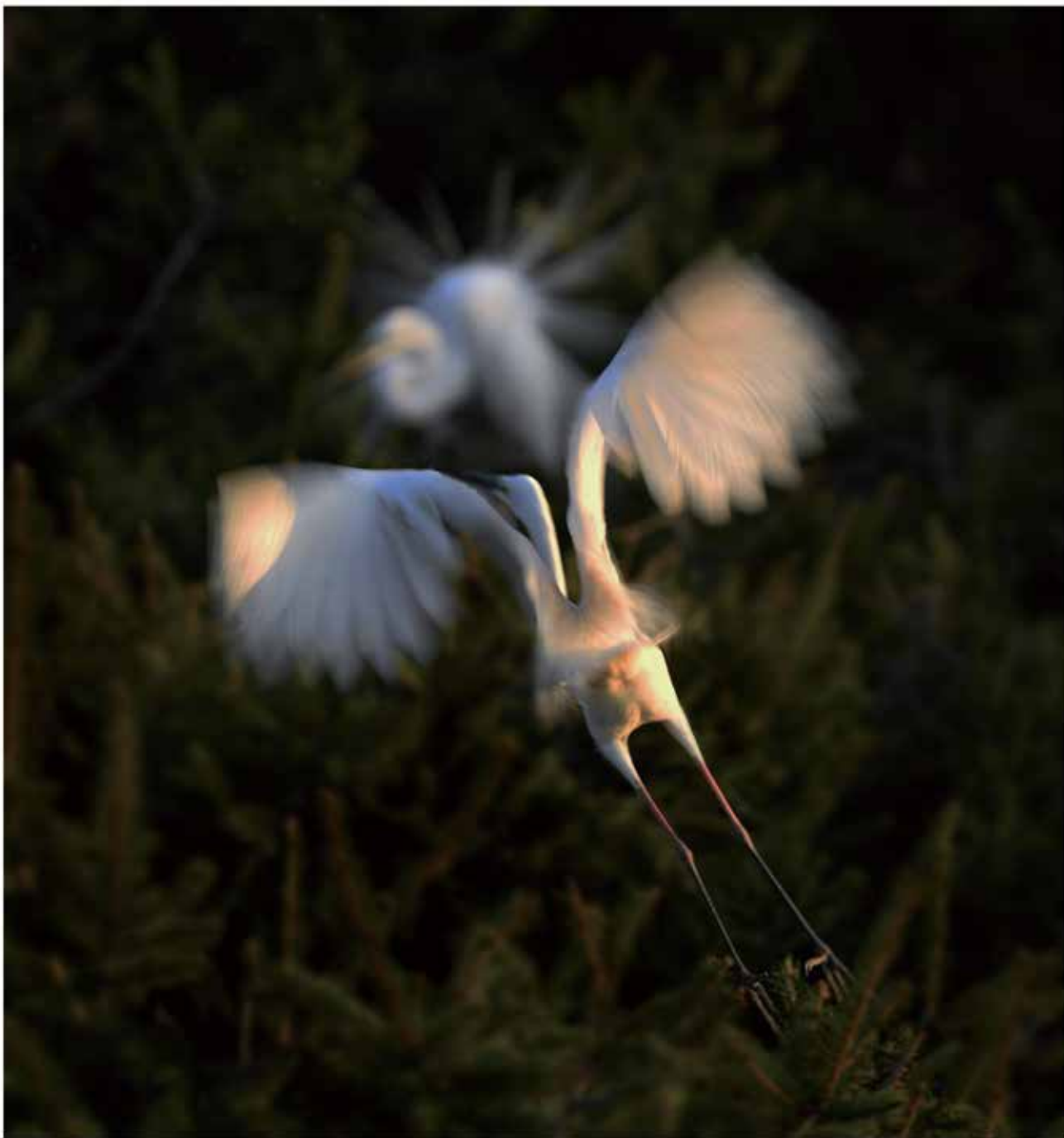
爱的季节我们相遇