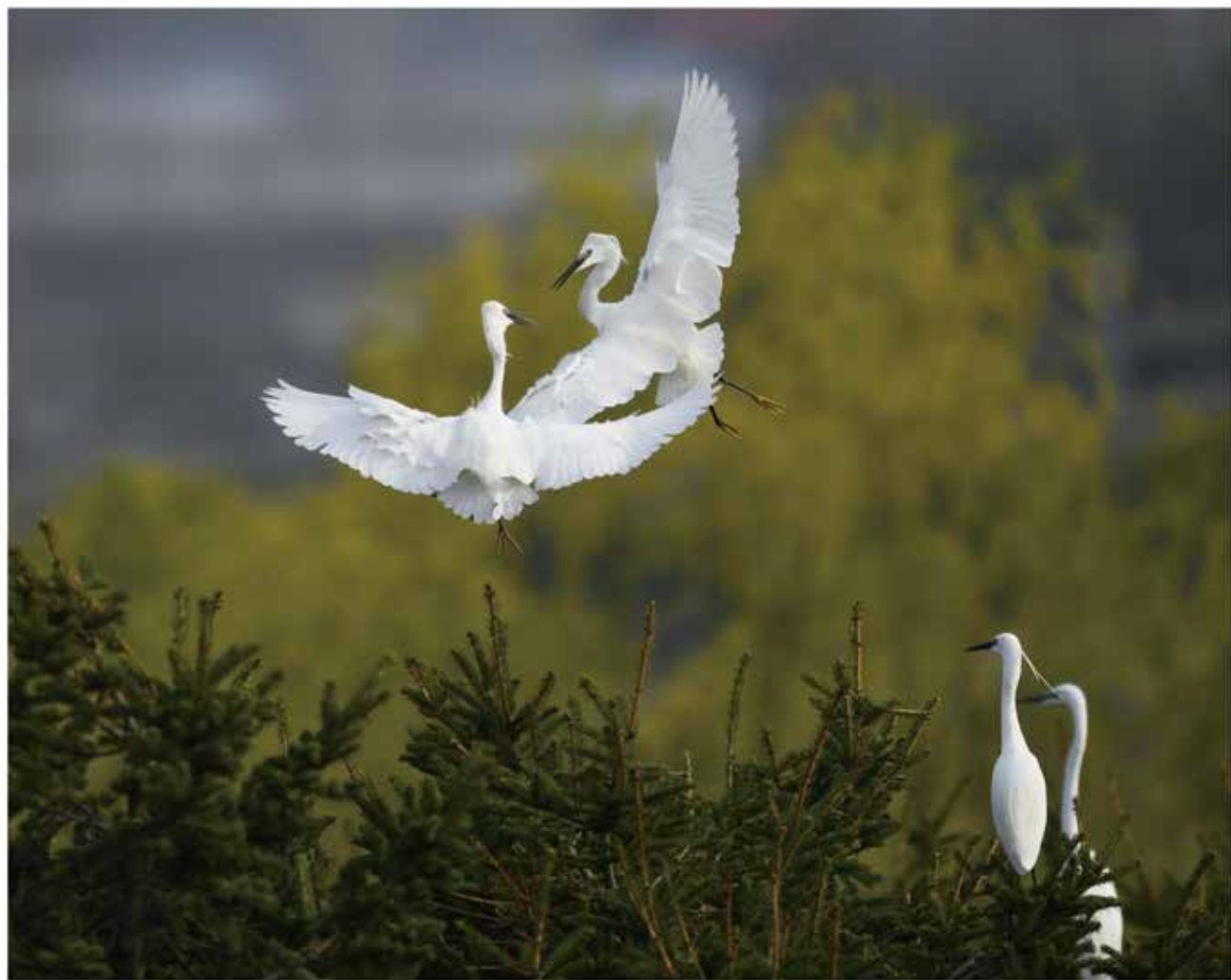
缠缠绵绵翩翩飞，飞跃红尘永相随 ——求偶成功，结为“夫妻”的一对白鹭通常会双双起舞，缠绵优雅