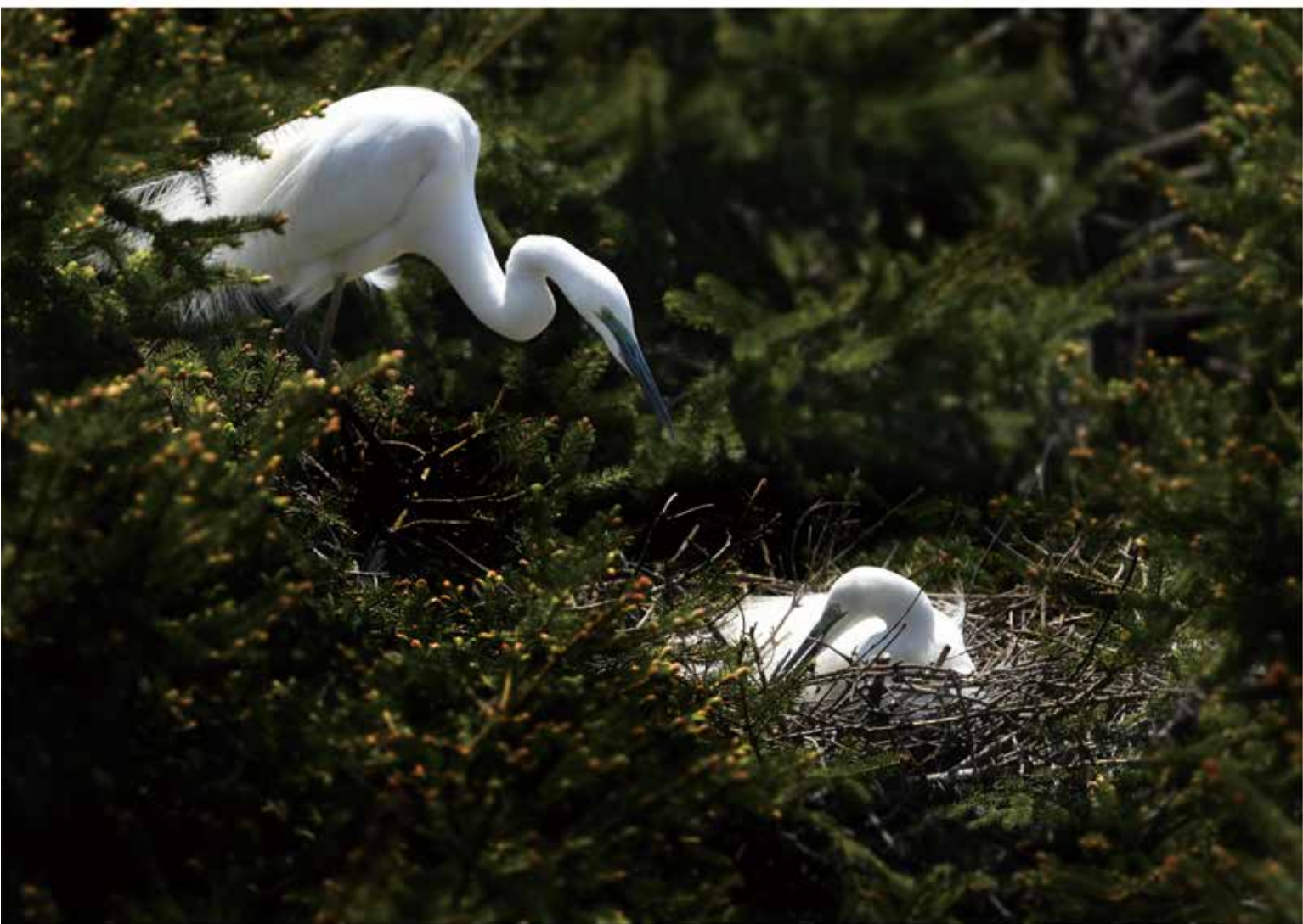
日复一日，专心孵化（大白鹭卵的孵化期为24~26天）