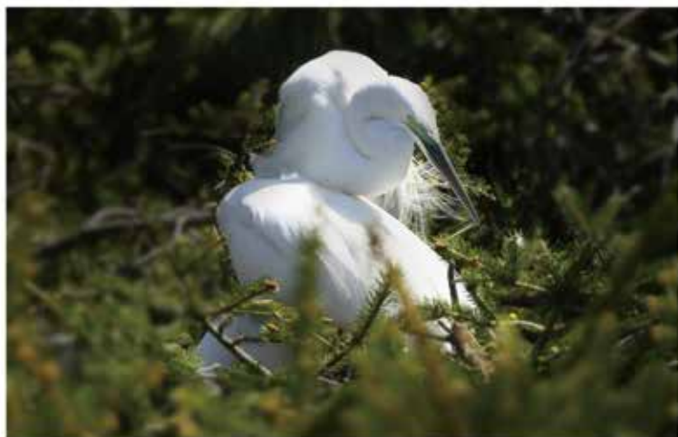
柔情蜜意，生命延续…… (交配 俗称“踩蛋”)