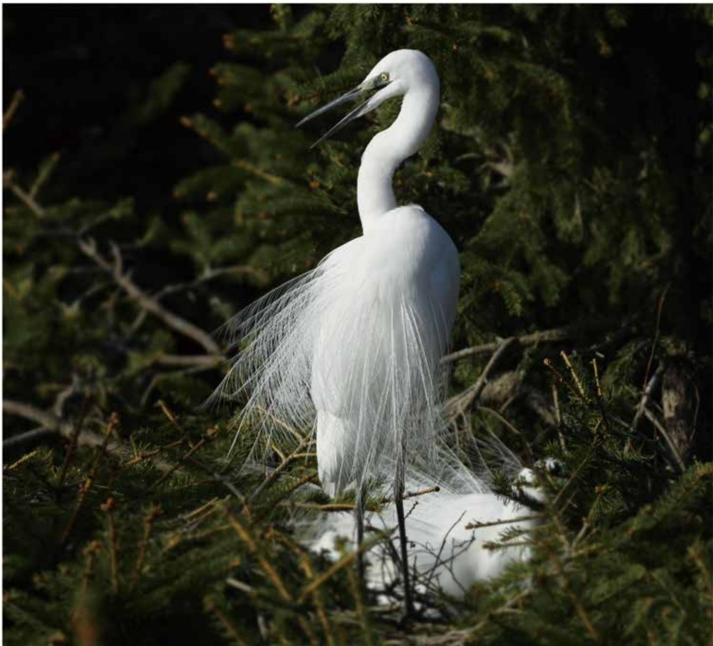
“新婚”之巢，孕育新生