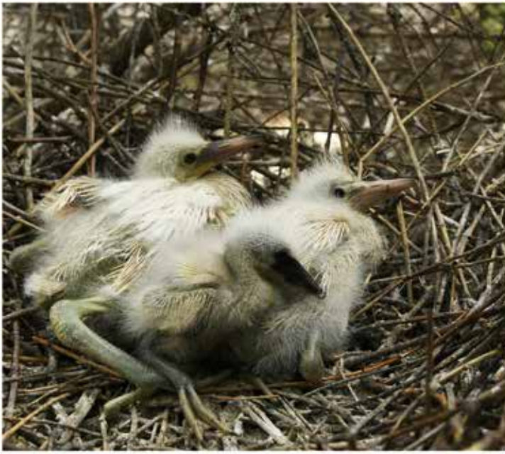
巢中小雏，无忧无虑