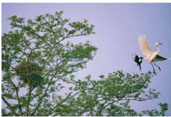
白鹭筑巢就地取材，相中了附近的喜鹊窝，一次次“窝底抽薪”，喜鹊奋起反抗，痛击“侵略者”